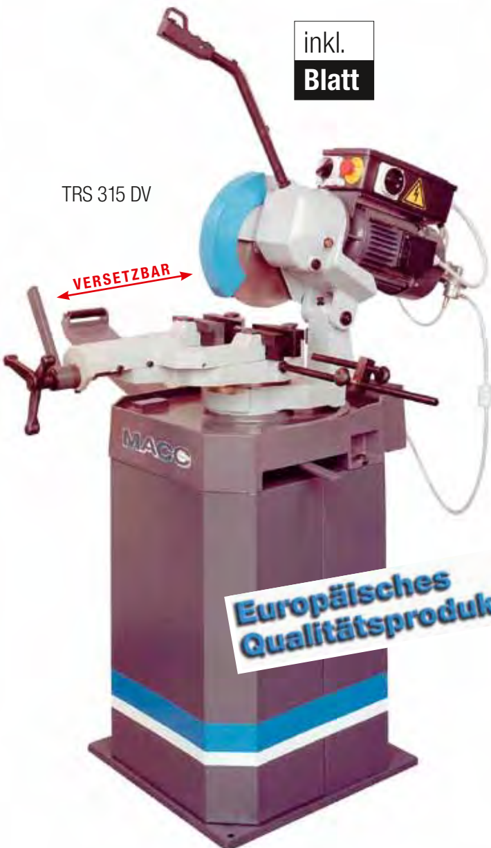
TRS 315 DV