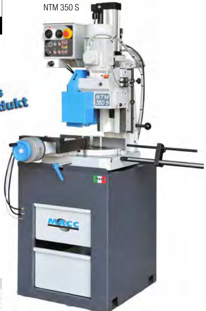
NTM 350 S