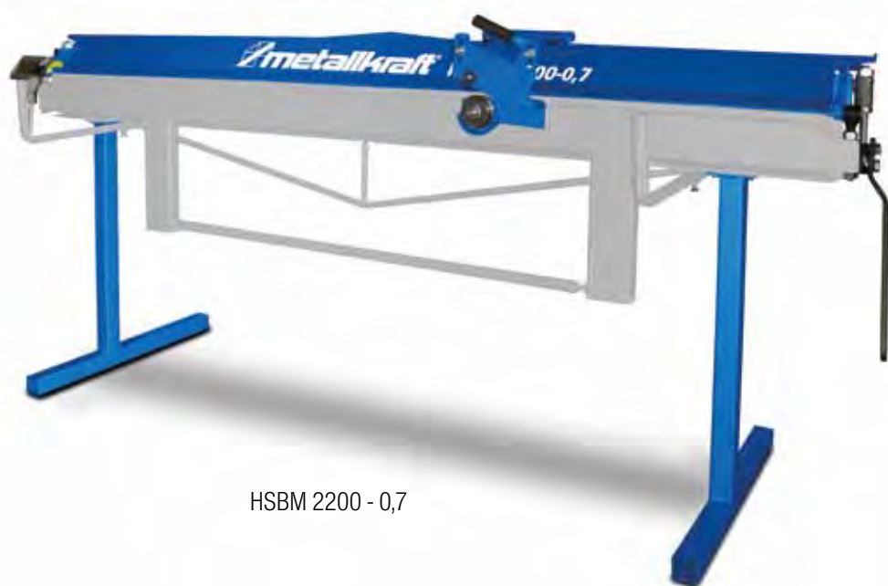
HSBM 2200 - 0,7