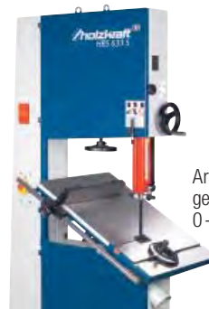
Arbeitstisch in geschwenkter Position 0-45°