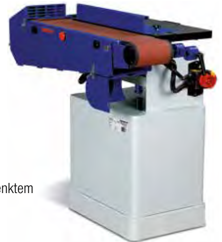
Abb. Mit geschwenktem Tisch